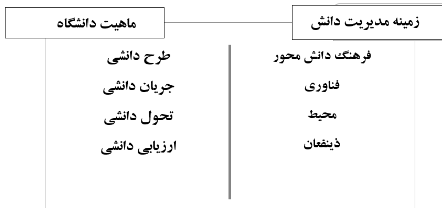
شکل ۲. ارائه الگوی مدیریت دانش در دانشگاه‌ها

پژوهش حاضر با هدف بررسی پژوهش‌های مربوط به الگو یا مدل مدیریت دانش در دانشگاه‌ها به روش فراترکیب کیفی انجام شده است. شکل ۲- خلاصه مهمترین نتایج پژوهش را در بعد اصلی ماهیت دانشگاه و زمینه مدیریت دانش گزارش می‌کند.