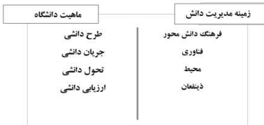
شکل ۲. ارائه الگوی مدیریت دانش در دانشگاه‌ها

پژوهش حاضر با هدف بررسی پژوهش‌های مربوط به الگو یا مدل مدیریت دانش در دانشگاه‌ها به روش فراترکیب کیفی انجام شده است. شکل ۲- خلاصه مهمترین نتایج پژوهش را در بعد اصلی ماهیت دانشگاه و زمینه مدیریت دانش گزارش می‌کند.