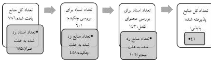
شکل ۲. روند جست‌وجو و انتخاب مقالات مناسب جهت تحلیل فراترکیب کیفی

تعداد کل مقالات و اسناد اولیه ۷۸۶ مقاله بوده است. این تعداد اسناد بعد از بررسی و پالایش بر اساس عنوان، تعداد ۱۸۵ مقاله از آن‌ها رد شد. در ادامه از تعداد ۶۰۱ مقاله باقیمانده، تعداد ۴۵۸ عدد دیگر نیز بر اساس عدم تناسب چکیده با اهداف پژوهش رد شدند. از تعداد ۱۴۳ مقاله باقیمانده ۱۰۲ مقاله دیگر نیز بر اساس محتوا حذف شدند. در شکل ۱- روند انتخاب ۴۱ مقاله پایانی جهت تحلیل فراترکیب عنوان شده است.