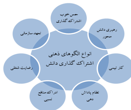
شکل ۱. نمودار الگوی مفهومی تحقیق

با توجه به مطالب مذکور الگوی مفهومی عوامل اشتراک گذاری دانش در بین کارکنان نسل Z در مرکز آموزشی-پژوهشی دفاعی مورد مطالعه به صورت زیر است: