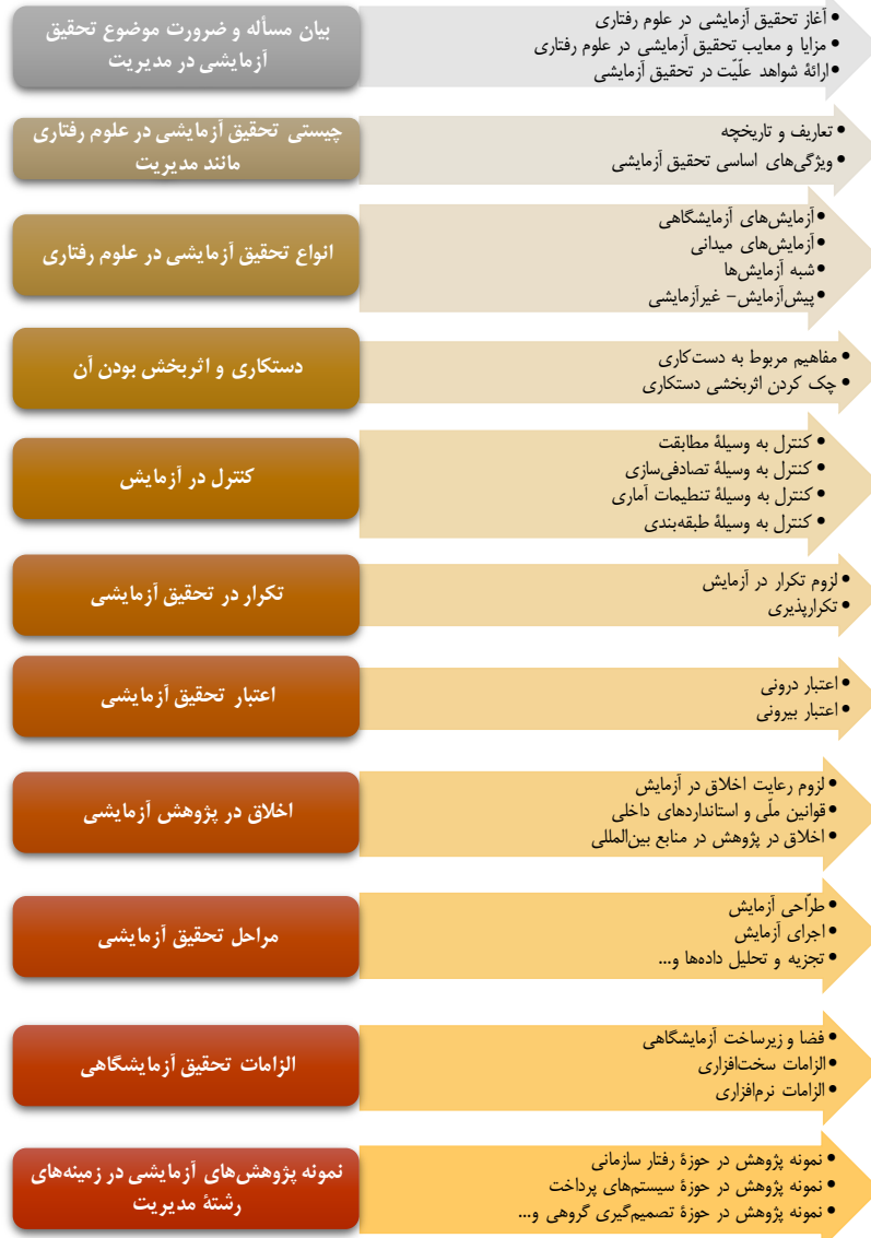
شکل ۳. مفاهیم مربوط به هر یک از مقولات موضوع تحقیق آزمایشی و کاربرد آن در مدیریت، حاصل از تجزیه و تحلیل پاسخ‌های دور دوم دلفی