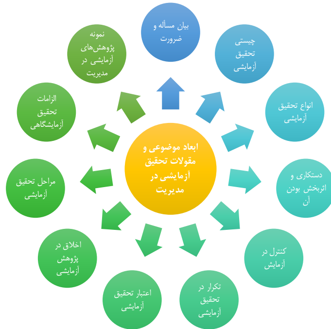
شکل ۲. مقولات حاصل از تجزیه و تحلیل پاسخ‌های دور اول دلفی با موضوع پژوهش

جلسات در این مرحله، معادل ۵ جلسه مصاحبه حضوری (با میانگین زمانی ۱/۵ ساعت) بوده است. ذخیره‌سازی اطلاعات توسط پژوهشگر در قالب ضبط صدا، یادداشت‌برداری، ثبت نتایج طوفان فکری و نقشه‌های ذهنی و رجوع به منابع علمی معرفی شده توسط اعضای پانل بوده است. از آنجا که فرآیند تحلیل این پژوهش از آغاز تا پایان، کیفی بوده است، نهایتاً و در پایان این مرحله، مقولات ذیل به‌عنوان چارچوب ارائه موضوع «بررسی روش تحقیق آزمایشی و کاربرد آن در مدیریت» استخراج گردیده است: